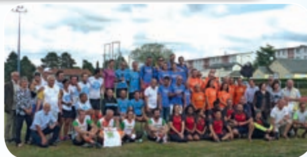
Que de fierté d'être arrivés au bout de ces épreuves.