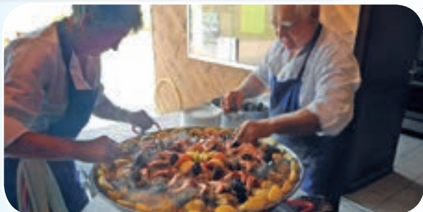
De quoi se régaler !