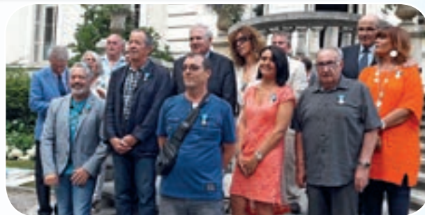
Remise des médailles par Mr le Préfet de la Haute-Savoie (au centre de la photo).