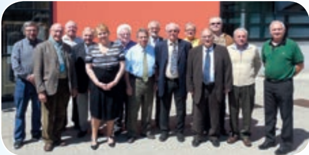
La nouvelle équipe est en place.