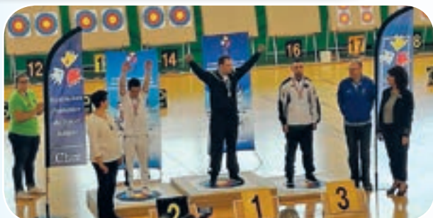
Moment intense que la remise des médailles aux vainqueurs.