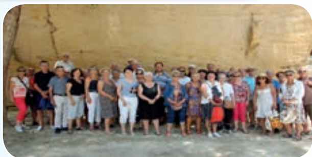
Un peu de fraîcheur lors de la visite des caves était venue bien à propos !