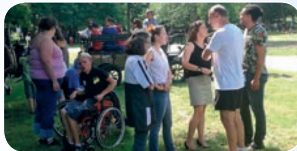
Les tours en calèche furent très appréciés. Lors de ces deux manifestations les bénévoles du CDMJSEA18 se sont mobilisés pour apporter leur aide aux organisateurs du CDSA18.

Autre manifestation avec le Comité Départemental sport Adapté du Cher qui organisait sur le site de Nançay une journée d'animation et de découverte des animaux de la ferme.